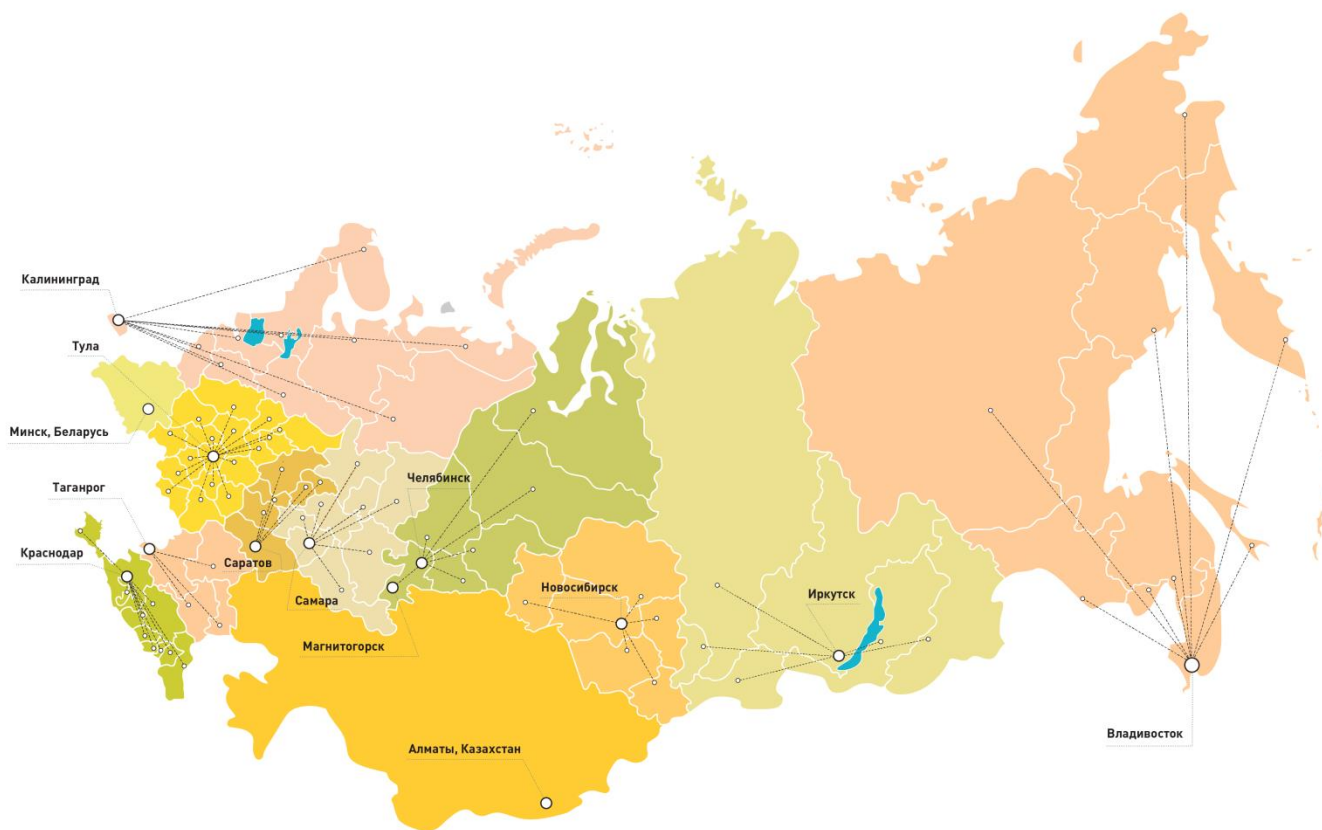
ГРАФИК СТАРТАП ТУРА 2016