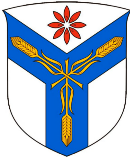
ПОЯСНИТЕЛЬНОЕ ИЗОБРАЖЕНИЕ герба Саратовского государственного аграрного университета имени Н.И. Вавилова в цвете